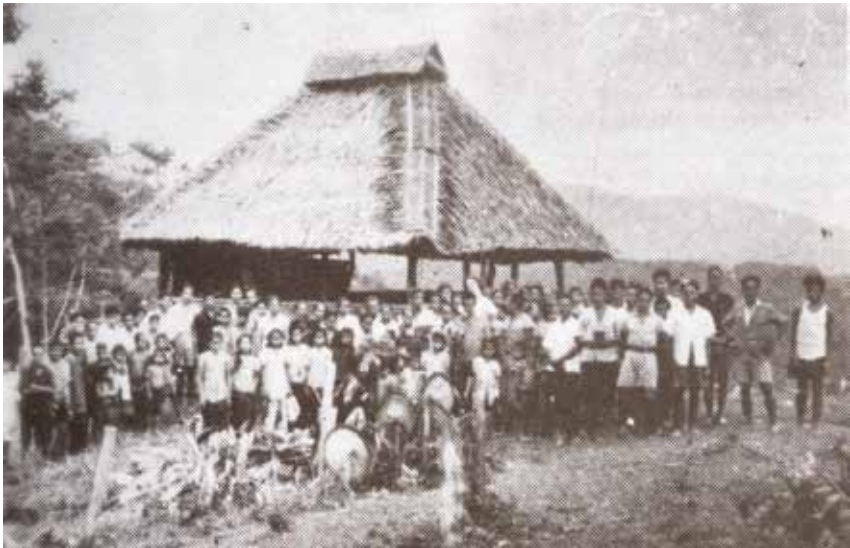
Gereja di kampung Nampasan pada tahun 1940.

Di Parad, pertumbuhan Kristian semakin merebak. Dengan tiga puluh empat Kristian, gereja pertama dibangun. Parad kemudian menjadi pusat penginjilan ke kawasan sekelilingnya seperti Kiau, Kaung, Gahui, Giuk, Tomis dan Tiung. Penduduk-penduduk kawasan ini belum pernah dijangkau Injil. Kehadiran sebuah gereja berdekatan kampung mereka telah menarik mereka ke sana. Roh Kudus bekerja dalam hati orang Dusun sehingga semakin hari semakin ramai yang percaya.