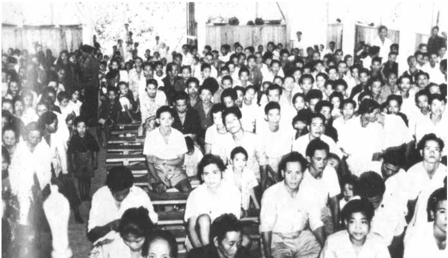
Salah satu ibadat di gereja Taginambur.

Kebangunan rohani yang bermula dengan kanak-kanak di Taginambur merebak kepada pemuda-pemudi sepanjang 1973-1975. Kehangatan rohani dan api Roh Kudus yang berkarya dalam kalangan mereka dirasai dalam gereja dan kampung. Kebangunan rohani mendatangkan pertumbuhan gereja walaupun iblis berusaha memecah belahkan jemaah Tuhan.