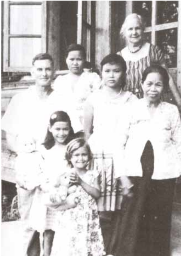
Asang menjadi orang Dusun dan beranak-pinak, bercucu-cicit sehingga keturunannya kini berada di Malaysia.