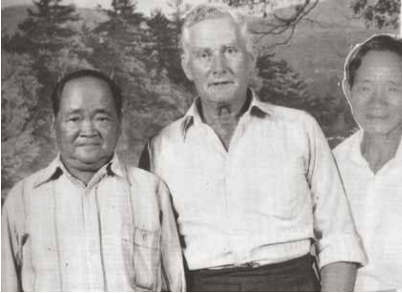
Ketuni, Asang dan Kerangkas melayani bersama-sama sebagai pelopor-pelopor dari muda hingga lanjut usia.