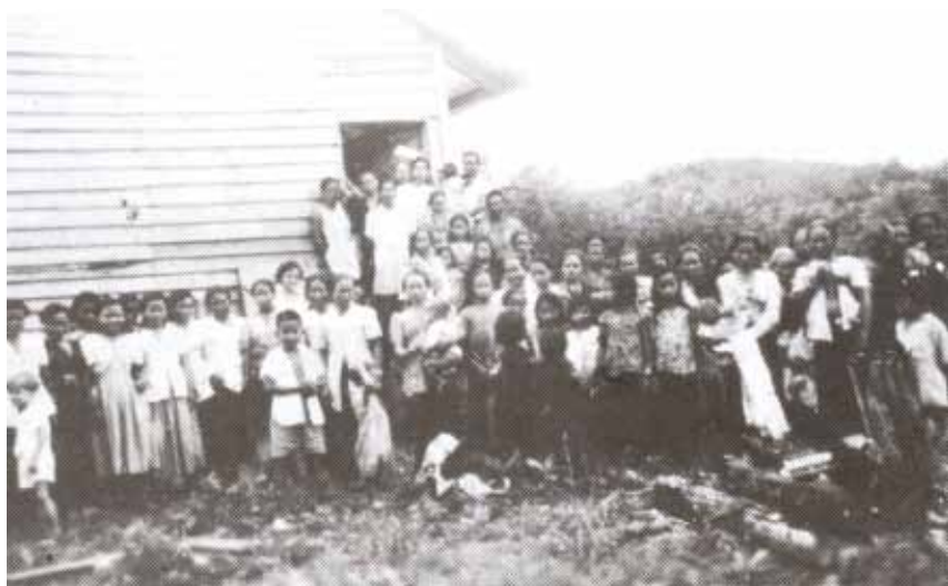
Sekolah pertama pada tahun 1955.

Bangunan sekolah ini juga digunakan oleh gereja baru yang sedang menantikan bangunan baru. Suasana sekolah ini sungguh meriah sepanjang minggu. Anak-anak yang belajar di sekolah juga kembali untuk mengikut sekolah minggu. Kampung yang pernah suatu ketika tidak diminati penduduk kini menjadi meriah dan hidup.