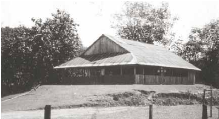
Gereja Taginambur yang bertahan lasak dari 1956 hingga 1981.

“ S egala perkara dapat kutanggung di dalam Dia yang memberi kekuatan kepadaku” (Filipi 4:13). Saat kecewa dalam pelayanan ditanggung oleh Asang dengan kekuatan Tuhan yang selalu mendukung dia dengan tangan Penghiburan-Nya. Ketenangan dan panjang sabar tetap dialaminya di tengah-tengah kemuraman cuaca.