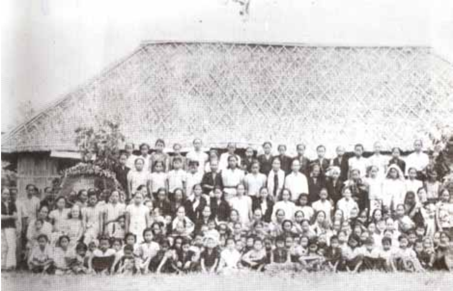
Orang Kristian Dusun akhir 1940 di Ranau.